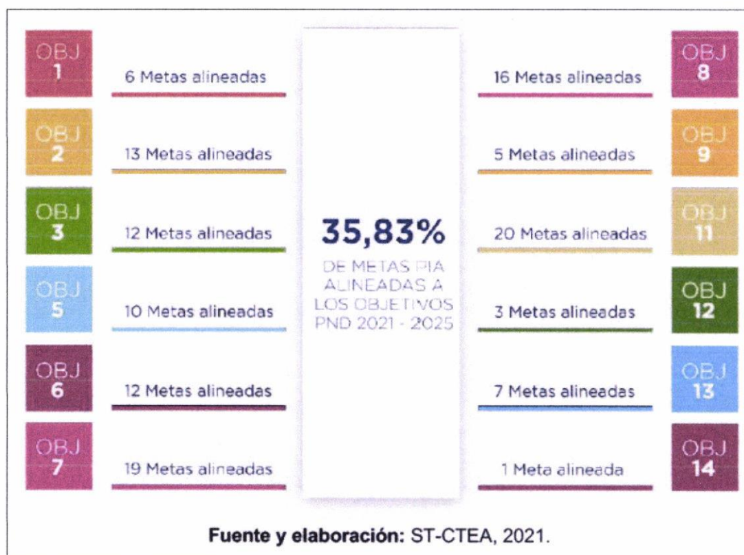
Gráfico N° 6 Metas alineadas al Plan Nacional del Desarrollo

Bajo este contexto, la política pública viene alineada al Plan Nacional de Desarrollo desde el año 2021 y la actual PIA.